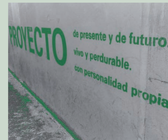
CURSO DE CREACIÓN DE EMPRESAS ORIENTADAS A MUJERES

EOI cuenta con un Patronato constituido por: Ministerio de Industria, Energía y Turismo; OEPM (Oficina Española de Patentes y Marcas); IDEA (Instituto para la Diversificación y Ahorro de la Energía); y RED.ES.