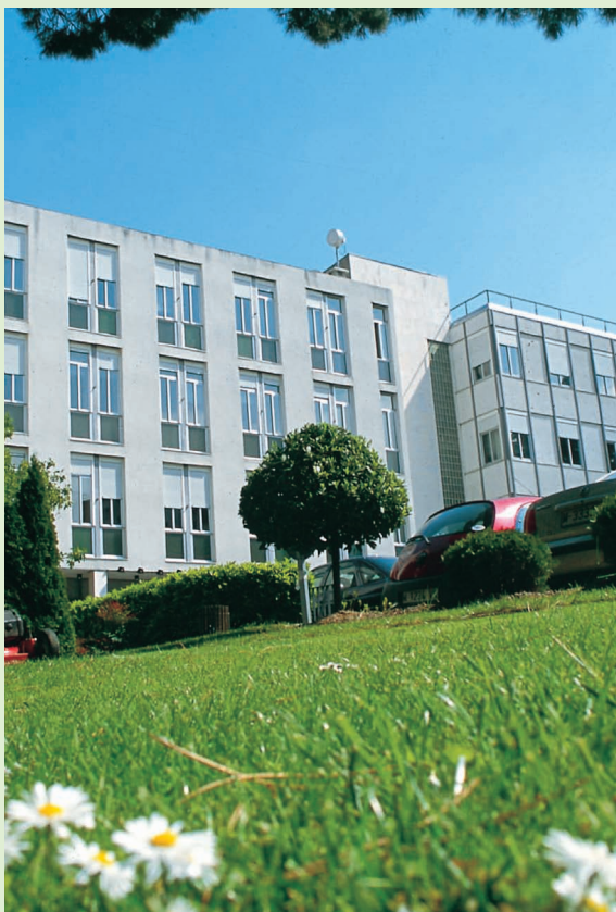
SEMINARIO PARA LA IMPLEMENTACIÓN DE PRODUCTOS Y SERVICIOS INNOVADORES

EOI-Escuela de Organización Industrial es la decana de las escuelas de dirección de empresas de España y cuenta con el respaldo de más de 50 años de formación. EOI está especializada en la Economía Sostenible, Economía Social y Economía Digital: Dirigida a formar futuros líderes y emprendedores del nuevo modelo productivo español y a Gestores de PYMES, Gestores Públicos y Gestores de la Economía Social en valores éticos, creatividad y emprendeduría, internacionalización, tecnología, desarrollo territorial y regulación.