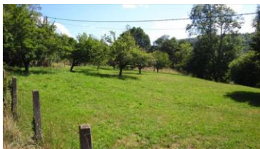
Parcelas de terreno Infrautilizadas