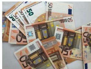
Altos precios debido a la especulación