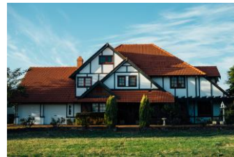
Elevados niveles de consumo de las viviendas tradicionales.

Ofrecemos una solución a la acumulación de contenedores marítimos en las zonas portuarias, empleando nuestra filosofía de economía circular para darles una nueva vida útil sin necesidad de que sean fundidos para la reutilización de acero con el ahorro en CO2 y energía que supone.